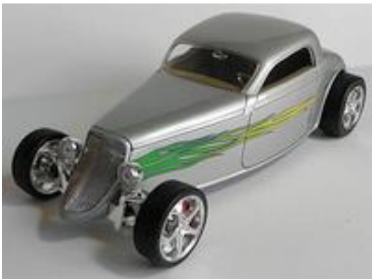
Ford Coupé 1933 als Hot Rod